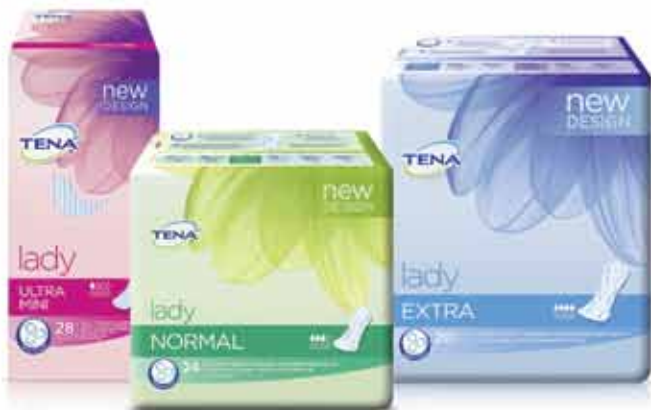
TENA Lady gyógyászati segédeszközök

A diszkrét TENA Lady betétek hármas védelme azonnali száraz érzést nyújt, hatékonyan felszívja a beérkező folyadékot és semlegesíti a kellemetlen szagokat, így minden helyzetben önmagam lehetek!