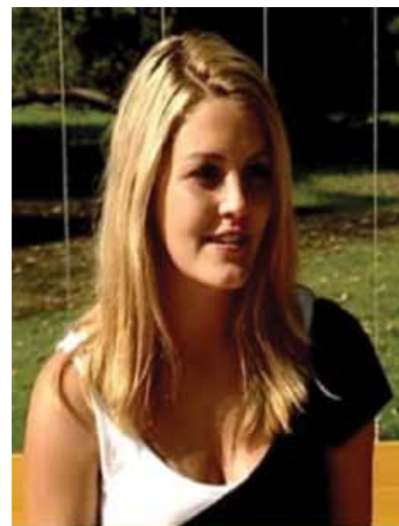
Tina súlyos betegséggel küzdött, de sikeresen felvette a harcot

A szerző az első magyar külföldön elismert neurotropikus agyterápia kifejlesztője. Szakmai cikkei megtalálhatóak az interneten.