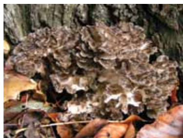
A bokrosomba aktiválhatja a falósejteket és az ölüsejteket, ezáltal tumorellenes hatása van

Az élőlények immunrendszere az egyik leghatékonyabb rákellenes fegyver. 1999-ben rákkutató tudósok arra lettek figyelmesek, hogy egérkísérleteik során egy egér a sok közül soha nem pusztult el rákban, még akkor sem, ha ismételt nagy mennyiségű ráksejteket fecskendeztek az állatba. Felfedezték, hogy ezeknél az egereknél immunsejtek vették körül és elpusztították a ráksejteket. A megmaradó tumorsejthulladékot pedig a falósejtek bekebelezték és megemésztették. A rákkal szemben immunitást élvező egereknél feltűnt a falósejtek és természetes ölüsejtek rendkívüli szerepe a betegség leküzdésében. A természetben fellelhető leghatékonyabb immunerősítő – a gyógygombakivonatokban megtalálható – polysaccharidok képesek a természetes ölüsejtek aktiválására és az áttétképződések gátlására. A patkányelvkivonat fogyasztásával például számos spontán tumorregressziót tapasztaltak még végső stádiumos betegek esetében is. A rákkal szemben ellenálló egér esetéből láthattuk, hogy az említett immunsejtek (természetes ölüsejtek és falósejtek) a létező leghatékonyabb tumorellenes fegyverre válhatnak, ha aktiválva vannak. Az említett polysaccharidok nem helyettesítik, hanem hatékonyan kiegészítik az onkológusok által javasolt kezeléseket.