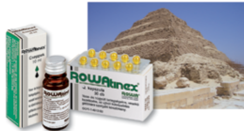
Vény nélkül, gyógyszerárakban kapható gyógyszer.

A Rowatinex kapszula és cseppek vese- és húgyúti megbetegedések (pl. vesekő vagy húgyvezetékben lévő kő és az ezekhez kapcsolódó tünetek) kezelésére, valamint az újbóli kőképződés gátlására, továbbá enyhe húgyúti fertőzésekben a vizeletválasztás elősegítésére szolgáló, gyulladáscsökkentő és enyhe antibakteriális hatású, simaizomok görcsét oldó gyógyszerkészítmény.