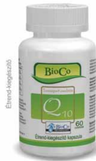
BioCo Q10 20 mg 60db