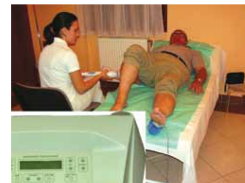
A 20 kezelés naponta 30-40 percet vesz mindössze igénybe.

További felvilágosítás: www.medhungary.com vagy 06-70/210-1513, 06-30/265-9360, 06-20/327-68-35, 06-72/551-714