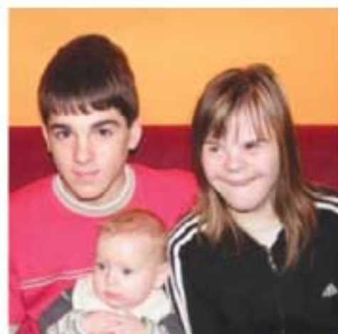
A három legjobbban sikerült gyerekünk

Református Egyház Bethesda Gyermekkorháza 1143 Budapest, Ilka u. 57. Tel.: 06-1-343-1626