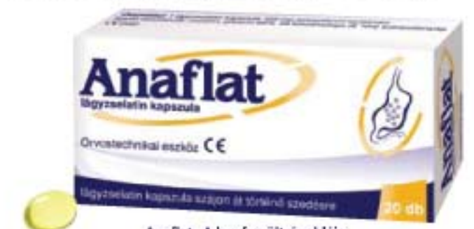
Anafat. A has feszültségoldója

következtében a buborékok fala elbomlik, és az így kiszabaduló gázok már képesek felszívódni a bélfalon keresztül! Az Anafat lágyzselés kapszula 125 mg szimetikon hatóanyagot tartalmaz, többet mint a legtöbb puffadás elleni szer, így adagolása is egyszerűbb. Ráadásul nagyon gazdaságos: egy kapszula alig több mint 40 Ft-ba kerül. A szimetikon tartalmú Anafat kapszulát étkezés közben érdemes bevenni, mert így az emésztés elejétől fejti ki biztonságos hatását, és a fokozott gázképződés eleve elkerülhető! A kapszula további előnye, hogy hatását kizárólag a falai önmagukon fejtik ki, ezért nem szívódik fel a szervezetben, hanem átalakulás nélkül távozik a széklettel. Különösen fontos ez a kismamáknál, hiszen a terhesség és szoptatás alatt a kapszula szedésének így nincs akadályja, mivel kémiai és biológiai reakcióba nem lép a szervezettel! Összegezve megállapíthatjuk, hogy csupán egy kis odafigyeléssel újra felfedezhetjük az étkezés gondtalan örömeit, békét köthetünk ételünkkel és ruháinkkal is!