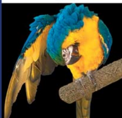
Igy lát a műtét után!