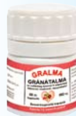
Pharmaforte Gránátalma 8. oldal

A Gyógyhír Magazin májusi számában hirdetett termékek közül az alábbiak rendelhetők meg a Gyógyhír Magazin internetes oldalán: