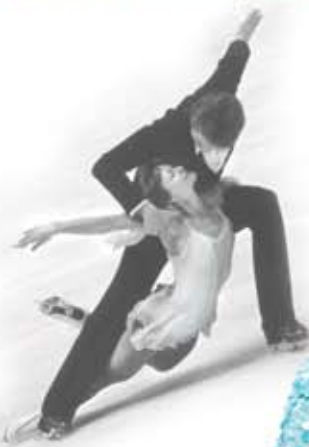
Regőczy Krisztina jégtánc világbajnok

„Már olimpikonként tudtam, mennyire fontos ízületeink egészsége. Most már tudom, hogy ez az aktív mindennapokban is nélkülözhetetlen.”