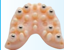
Orimag-fogyasztó 31. oldal