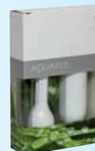
Aquatús intimzuhany termékcsalád 25. oldal