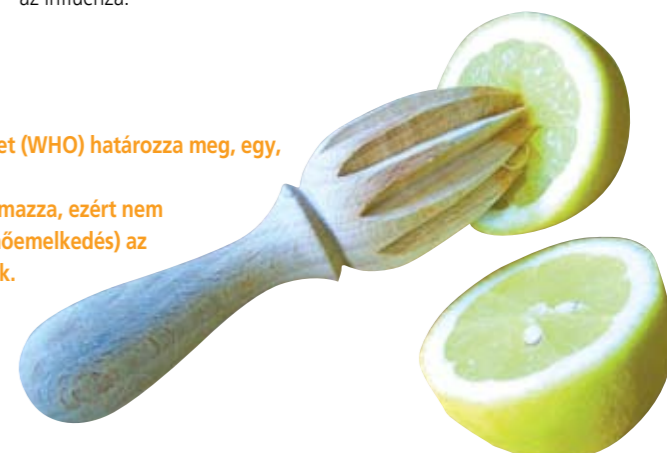
▶ folytatás a 14. oldalon